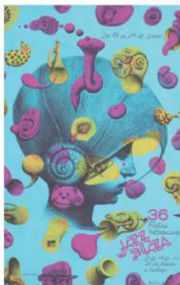
Autor: ROBERTO FABELO Basada en la obra: FIESTA SONORA