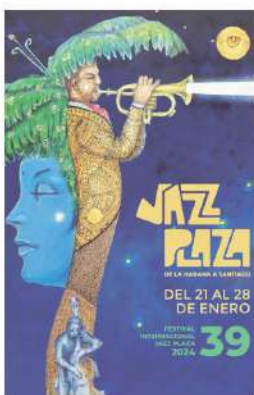
Autor: ROBERTO "BOBBY" CARCASSÉS Basada en la obra: JAZZ PLAZA