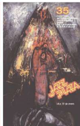
Autor: NELSON DOMÍNGUEZ Basada en la obra: EL OTRO MUNCH