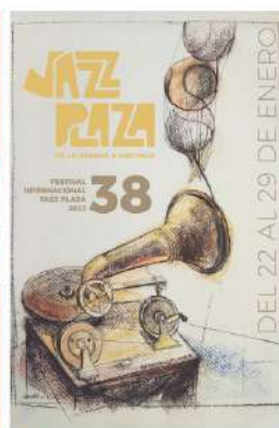
Autor: ARTURO MONTOTO Basada en la obra: BASEBALL PLAYER