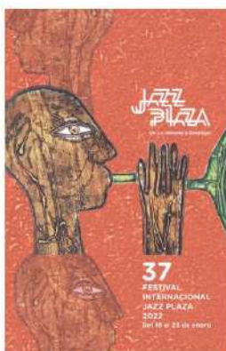
Autor: EDUARDO ROCA SALAZAR "CHOCO" Basada en la obra: TROMPETA CHINA