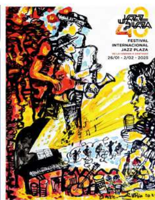
Autor: ZAIDA DEL RÍO Basada en la obra: JAZZ