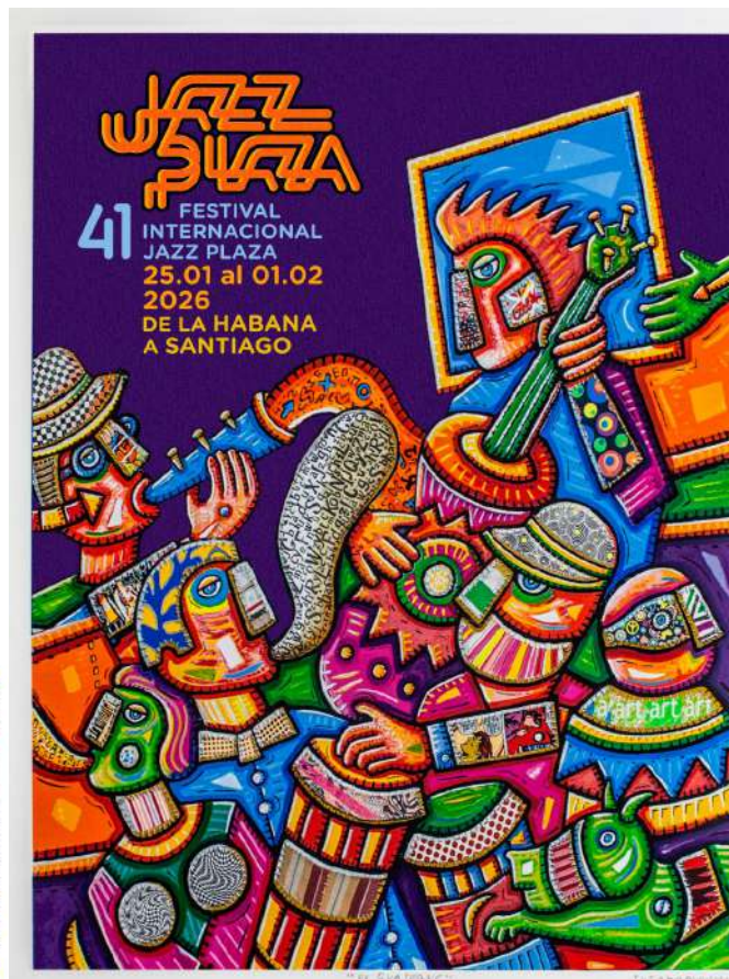
Autor: ALFREDO SOSABRAVO Basada en la obra: EL GUATEQUE