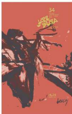
Autor: ALBERTO LESCAY Basada en la obra: JAZZ = LIBERTAD